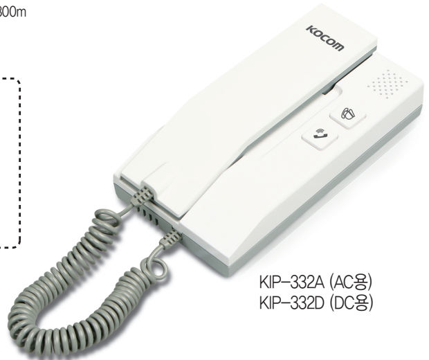
KIP-332A (AC용) KIP-332D (DC용)

저희 제품을 구입하여 주셔서 대단히 감사합니다. 사용전에 잘 읽어보시고 반드시 보관하세요. 감사합니다.